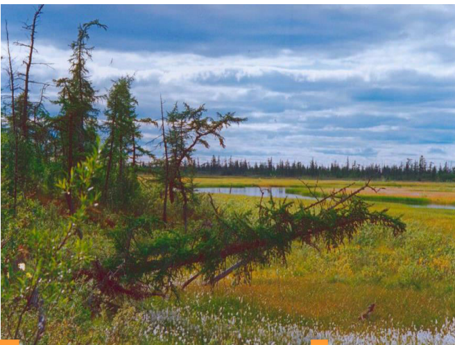
Первая стоянка «Болото»