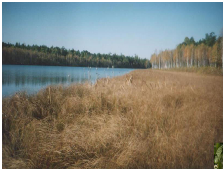
Вторая - «Озеро»