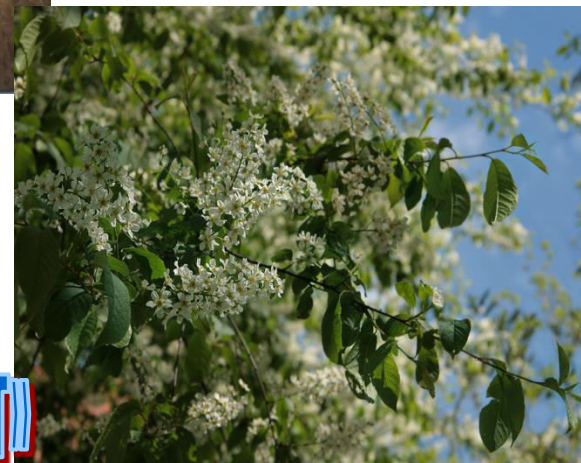
Конечная стоянка «Черемуховый куст»